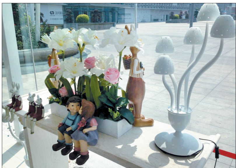
「水晶房」里的浪漫和浪漫