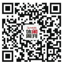
《洛阳晚报·休闲周刊》二维码

世界杯赛事正酣,暑假也将到来。运动要从娃娃抓起,如果孩子不知道暑期用什么充实生活,家长不妨带他或鼓励他去运动。不管是应付达标测试还是让其拥有强健的体魄和坚强的意志,运动都是绝佳的选择。运动吧,以世界杯之名。