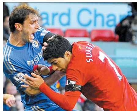
苏亚雷斯(右)在英超赛场上咬人

国际足联允许苏亚雷斯和乌拉圭足协在当地时间25日下午5点前提供说明材料，解释当时的情况，并表明他们的立场。如果书面证明不能有效说服国际足联，苏亚雷斯并非故意，或对手首先有挑衅和攻击行为，“苏神”这次还得禁赛。有媒体称，一旦认定，苏亚雷斯或被禁赛两年。