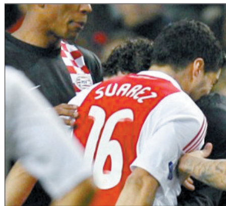
苏亚雷斯在荷甲赛场上咬人