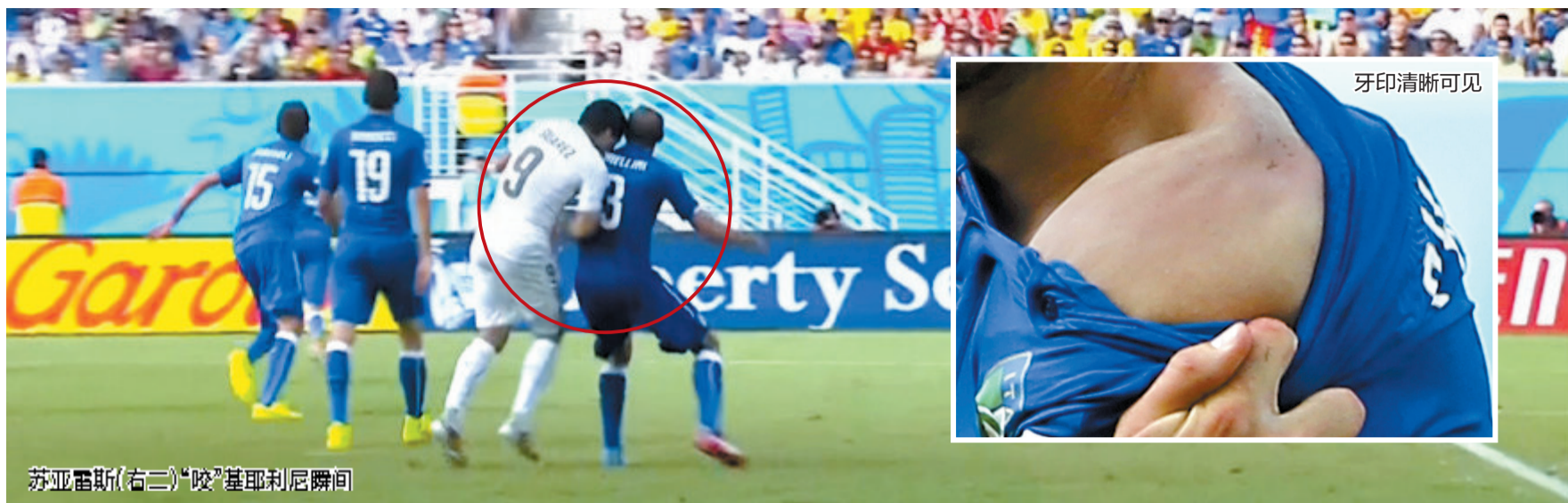
苏亚雷斯(右二)“咬”基耶利尼瞬间