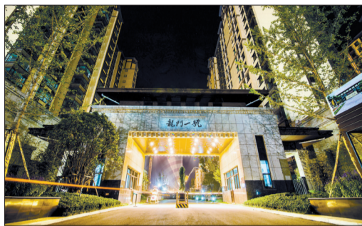
龙门一号夜景