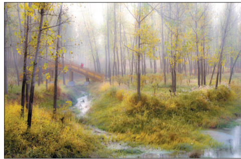
湿地公园秋景