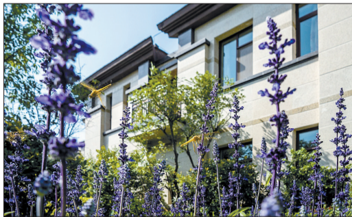
住在花丛中