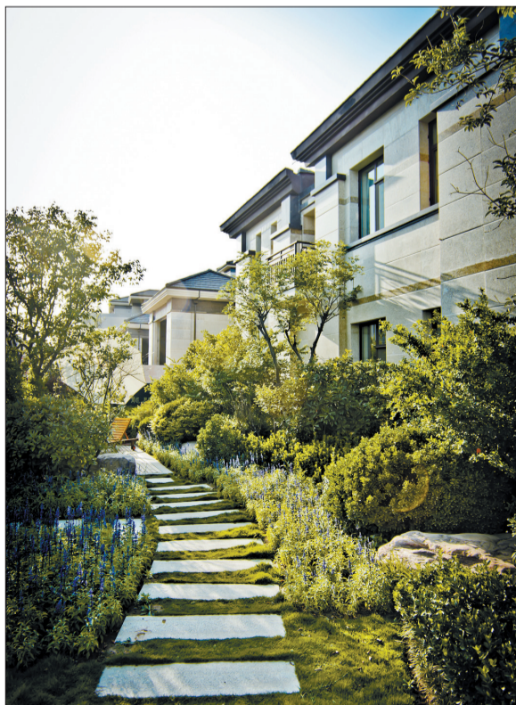
龙门一号别墅区实景