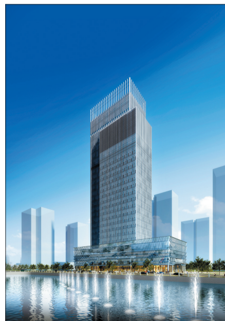
泉舜186效果图 (资料图片)

在施工现场,笔者注意到几名资深设计师正在对现场格局进行深度规划。据一名设计师介绍,这次比赛的7.2米空间挑高设计是吸引并促使他参赛的主要原因之一,在洛阳,这样的层高是绝无仅有的,也可能是首次出现这样的办公空间,可以近距离接触甚至参与设计这种独特的产品,对自己来说是个难得的机会。7.2米层高现场感受非常震撼,给人一种视觉冲击力,不仅对设计师非常具有挑战性,而且给业主提供更为大气、宽敞的办公环境。