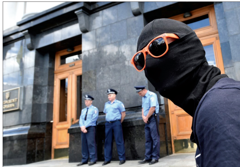
当地时间6月28日，在乌克兰基辅，激进的青年组织成员在乌总统办公室外举行集会，要求总统停止在东部地区的停火协议