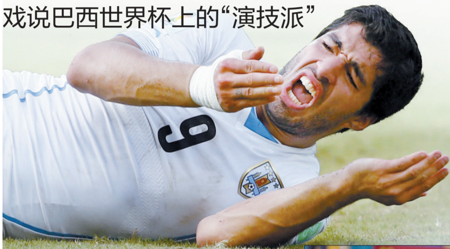
苏亚雷斯咬人后倒地哀嚎