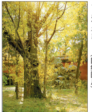
慈宁宫正殿 慈宁花园