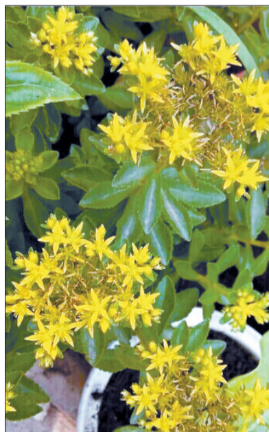
●名称:景天三七 ●拍摄时间:6月下旬 ●拍摄地点:高新开发区火炬园 (线索奖30元)