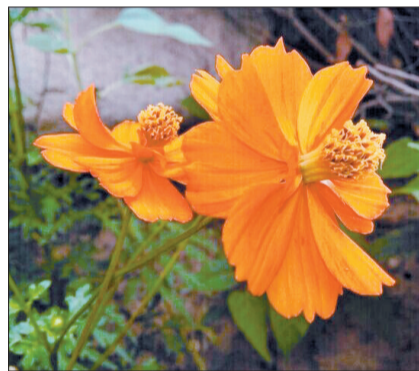
●名称:硫华菊 ●拍摄时间:6月底 ●花语:野性美

晚报微信网友 李晖 拍摄(线索奖30元) (请晚报微信网友“李晖”告知真实姓名和联系方式,以奉薄酬)