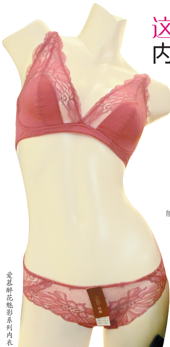
爱慕醉花魅影系列内衣

本次世界杯太太购物团活动已圆满收官,在今后的日子里,“洛报商业”微信公众号还会联合诸多商家,推出更多超值回馈活动。