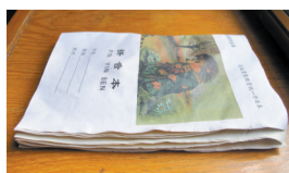
自然晾干的作业本皱得厉害