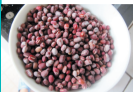
稍煮过被冷冻的红豆