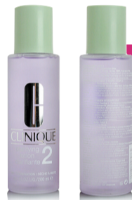
倩碧2号保湿洁肤水