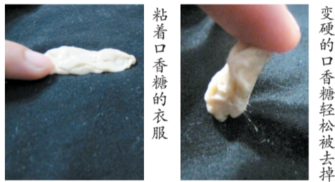
粘着口香糖的衣服