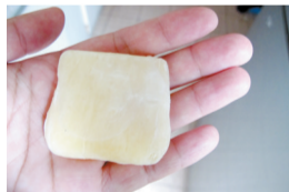
冷冻后的肥皂依然比较软