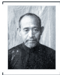
日本战犯铃木启久的肖像

李明华介绍,除了公布这45名被起诉战犯的自供记录,中央档案馆正在着手整理没有被判刑的1017名日本战犯的笔供,将在适当的时候以适当的形式公布。