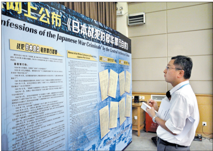
7月3日,日本《朝日新闻》的记者在新闻发布会前记录展板上的内容