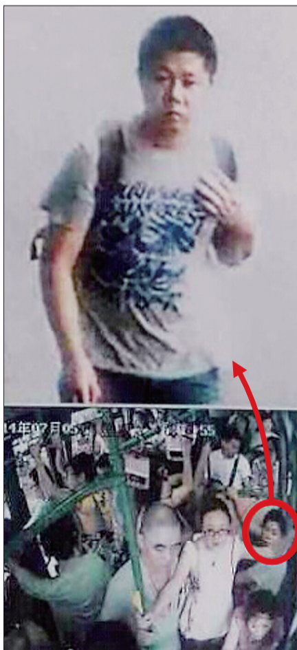
▲嫌疑人照片

“香蕉水”又名天那水,是无色透明易挥发的液体,有较浓的香蕉气味,微溶于水,能溶于各种有机溶剂,易燃,主要用于喷漆的溶剂和稀释剂。在许多化工产品、涂料、黏合剂的生产过程中也会用“香蕉水”做溶剂。其蒸气与空气混合可形成爆炸性混合物,遇明火、高热可引起燃烧、爆炸;与氧化剂可发生反应,若遇高热,容器内压增大,有开裂和爆炸的危险。