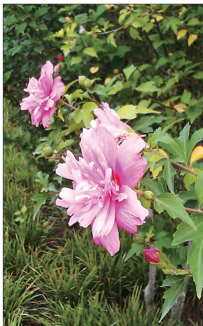
●名称:木槿花 ●拍摄时间:7月初 ●拍摄地点:洛浦公园东段 ●花语:温柔的坚持