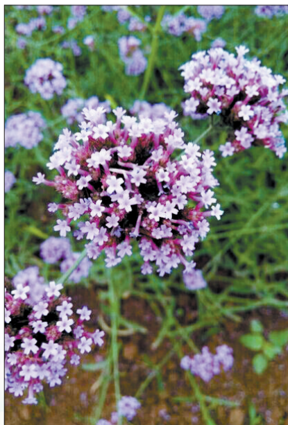
●名称:柳叶马鞭草 ●拍摄时间:6月底 ●拍摄地点:薰衣草庄园