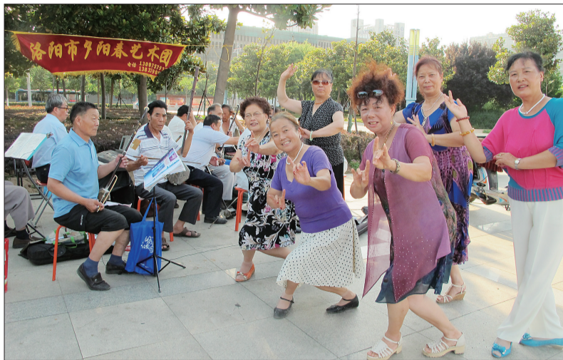
夕阳春艺术团成员在表演

老两口在家一个拉一个唱,儿女拍手鼓劲儿,小孙女也迷上了唱戏,整天跟着爷爷奶奶屁股后面,学得有模有样,家里戏声连连,笑声不断。