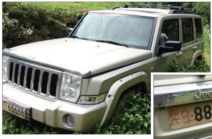
用来祭奠亡父的越野车 (网络图片)