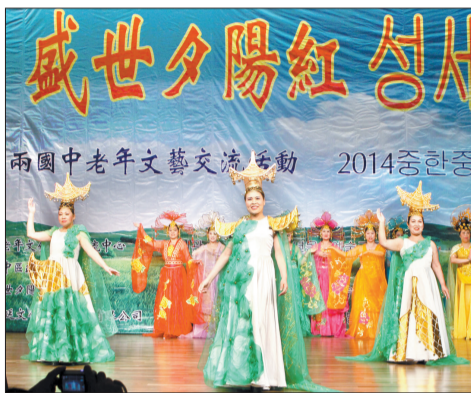
艺术团成在在韩国表演