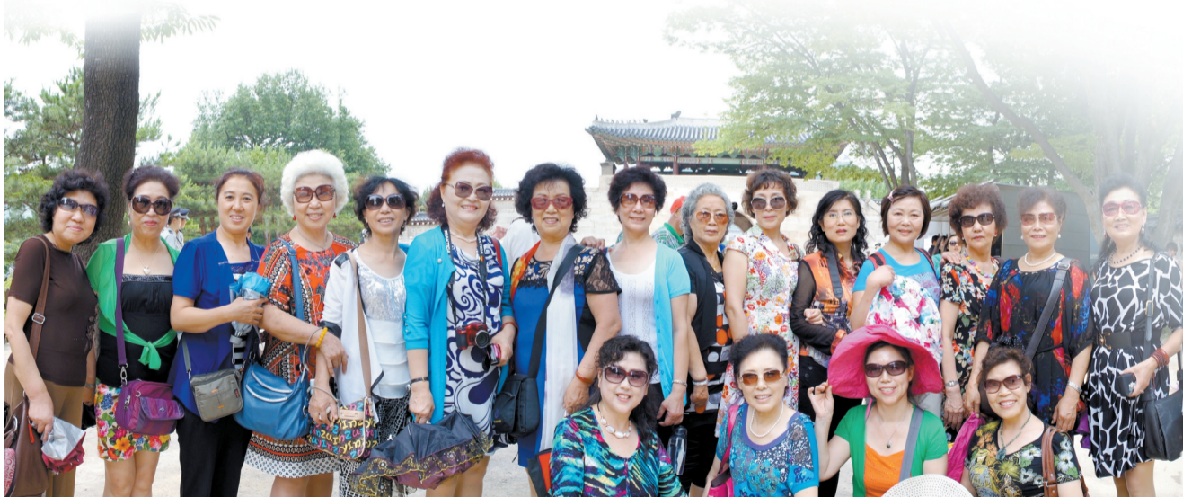
爱美的金秋中老年时装表演艺术团成