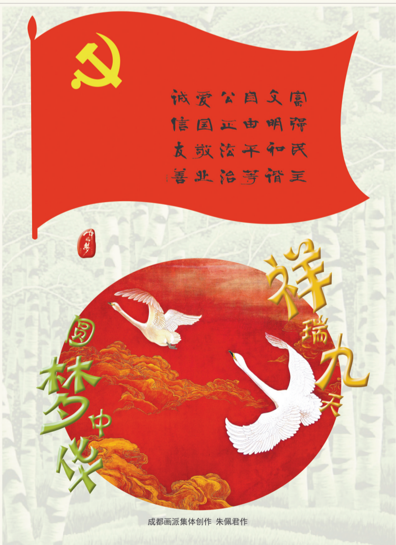
成都画派集体创作 朱佩君作