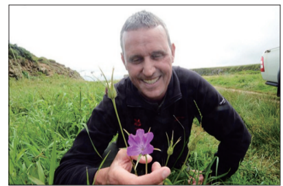
霍顿发现了这朵“毒花”