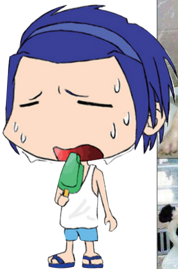
(本版稿件均据网络整理)

这两天天气太热,动物们也有避暑良方。看这些动物享受的样子,简直萌爆了。