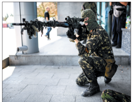
7月21日,在顿涅茨克城边的火车站,一名当地民间武装人员持枪警戒