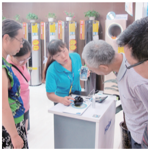
体验师们“听课”很认真