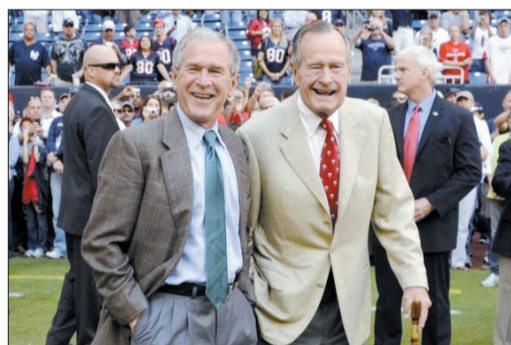
2009年10月25日,老布什(前排右)和小布什(前排左)在休斯敦观看球赛

老布什在今年6月迎来90岁生日。美联社称,老布什是美国现代史上为数不多的几个没有写回忆录的总统,而小布什在卸任后第二年即出版自传《抉择时刻》,今年4月还举办个人画展,画展中有他画的一幅老布什画像。