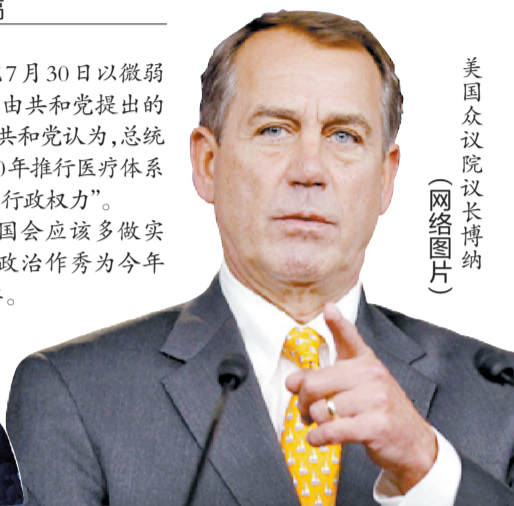
美国众议院议长博纳