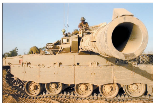
7月30日,在以色列与加沙地带边界,以色列士兵坐在一辆坦克顶上