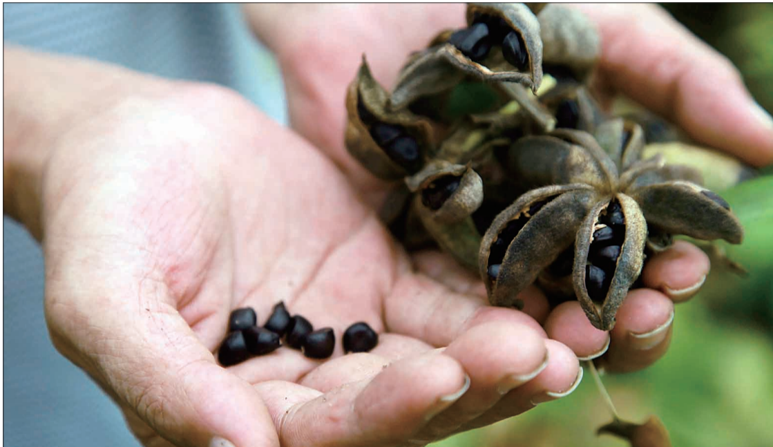
从牡丹角中剥离牡丹籽