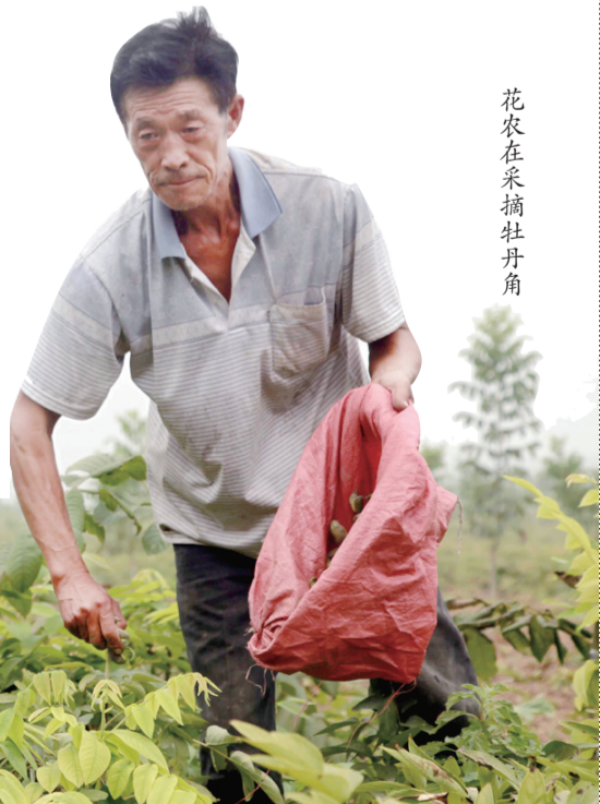
花农在采摘牡丹角