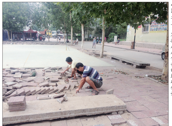
小区业主自发把屡屡伤娃的地砖铺好

对施工工地没有设置防护围挡一事,洛龙区教育局基建办负责人有些无奈:“小区居民一看到有工人进入空地,便会一哄而上进行阻挠,我们没法儿靠近。”曹屯居委会的负责人也非常着急,他告诉记者,在继续向居民作解释的同时,他们也会想办法尽快把这块空地给围起来,不再给小区居民,特别是孩子们带来危险。