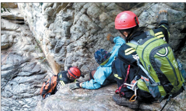
救援人员帮助被困驴友下山

2012年,山东省泰安市政府出台了《关于加强泰山风景名胜区非游览线路进山管理的通告》,对未经批准从非游览线路进山的人员,最多可处以5000元的罚款。