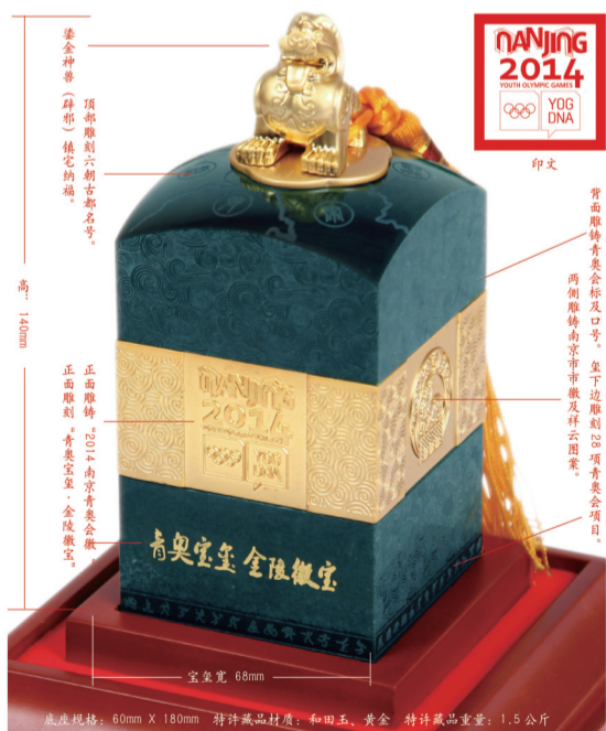
中国首次举办青奥会,六朝古都深厚文化底蕴与奥林匹克精神的完美融合,玺之重器——“青奥宝玺·金陵徽宝”将承载见证历史! 收藏意义重大!

亮点4 纯手工: 青奥会纯手工雕琢的艺术珍品,艺术家的完美工艺成为价值保障的又一重砝码,每方“青奥宝玺·金陵徽宝”的重量和纹理都是独一无二的,堪称2014南京青奥会的扛鼎之作。