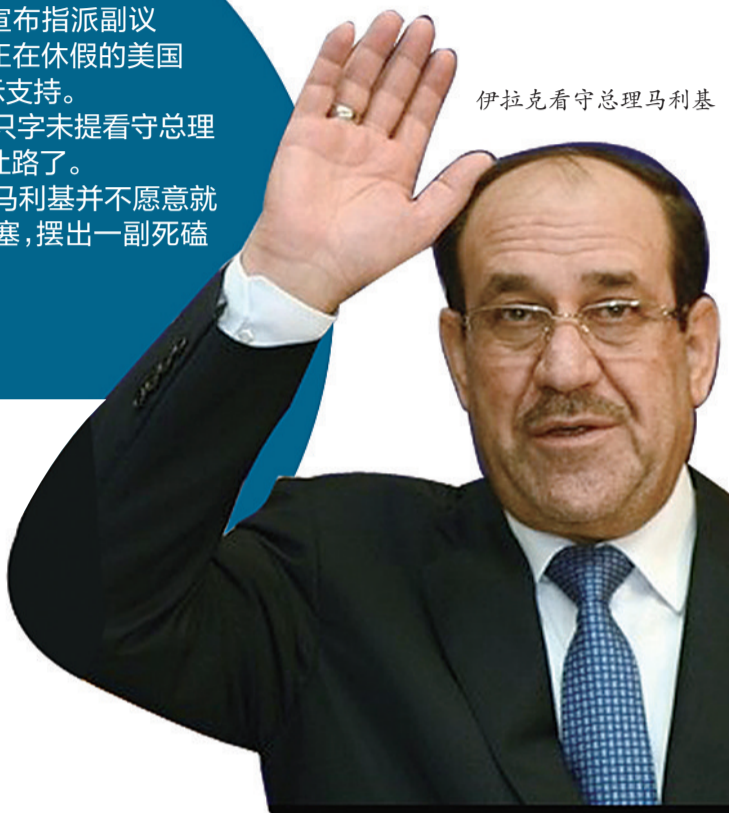
伊拉克看守总理马利基