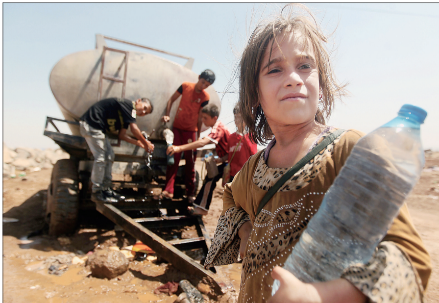
8月14日,在叙利亚东北部的难民营,伊拉克雅兹迪教教徒从水罐车接取饮用水

多名伊拉克官员证实,宗教极端组织“伊拉克和黎凡特伊斯兰国”(下文简称“伊黎”)15日在伊北部一座村庄杀害大约80名雅兹迪教派男子并掳走妇女和儿童。