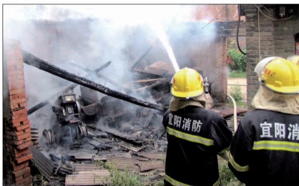
院内的拖拉机被烧得只剩下骨架