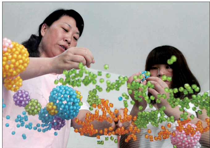
这些色彩鲜艳的小珠子,在妞妞(右)的手中变成美丽的工艺品