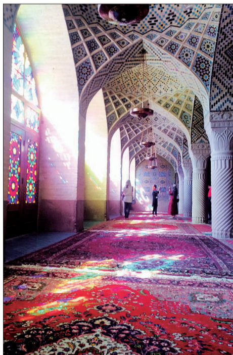
阳光透过彩色玻璃投射到波斯地毯上，发出梦幻般的七色光