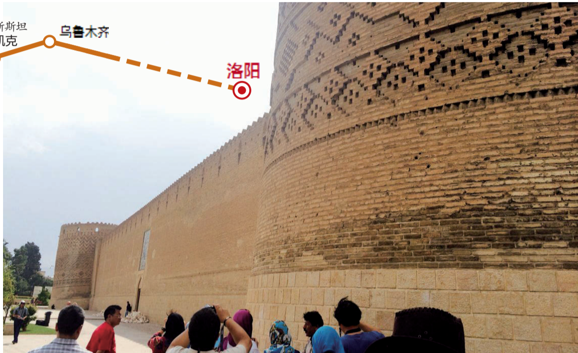
克里穆罕城堡一角的炮台倾斜如比萨斜塔

设拉子意为“有柏树的都市”，以玫瑰、夜莺和诗人的故乡著称，处处散发着浪漫的气息。它是今天波斯省的省会，也是古波斯文明的中心，已有4000多年的历史。在这里，我们通过随处可见的清真寺、花园和古堡等，近距离认识了一下波斯。