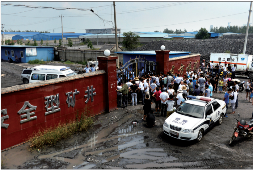
东方煤矿外景