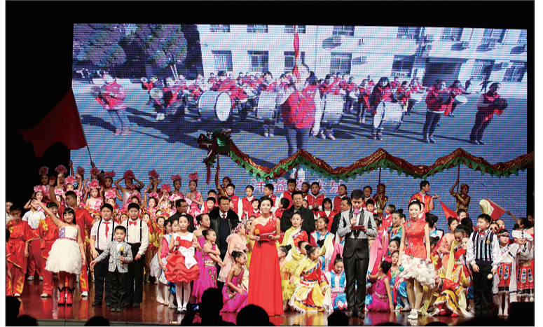
口才班学员在小记者春晚上做主持