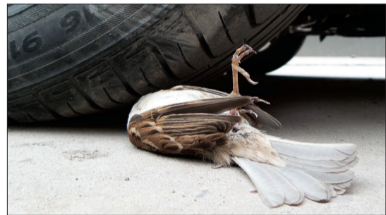
车轮下,消逝的生命