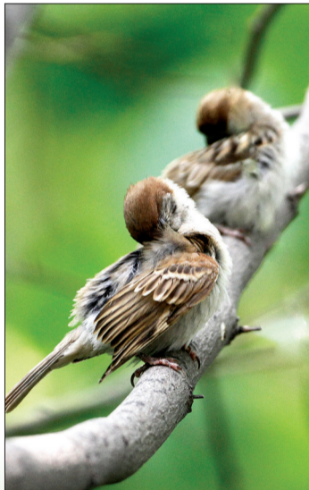
两只小麻雀,一起来梳妆

8月15日,小鸟羽翼丰满,外表与父母已没有太大差别。明年,这些小鸟也要开始繁殖下一代,也许它们会选择自己出生的地方——69号晚报鸟巢,来养育自己的下一代?但愿到那时,69号可以成为它们温暖而安全的港湾。