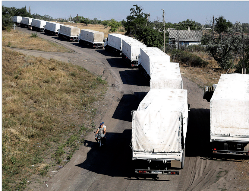
8月23日，在乌克兰边境小镇伊兹瓦里诺，援助车队的卡车驶离边检站

德罗贝舍夫斯基当天在接受俄媒体采访时说：“上述说法令人困惑不解，因为乌克兰和俄罗斯的边防和海关人员对所有车辆进行了检查。”他指出，包括外国媒体在内的众多记者都“可以独立得出所有车辆均是空车返回的结论”。