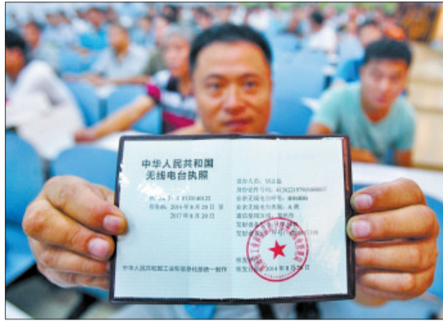
无线电爱好者领取的电台执照

据郑州市无线电管理局负责人介绍,使用功率0.5瓦以下的不用办理手续,但市场上售卖的对讲机多是5瓦以上的,都须申请电台执照,否则就是非法使用。办理业余无线电台使用手续:首先,业余无线电爱好者参加河南省无线电协会举办的操作技术能力测试,并取得中国无线电协会业余电台操作证书。其次,向当地无线电管理局提交申请材料。再次,设备使用与检测。业余无线电台无