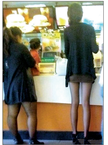
有些女人穿丝袜，显得身材好。 有些女人穿丝袜，显得丝袜质量好。 (据新浪微博)