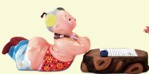
泥人张彩塑 王润霖作