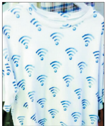
穿了这衣服,信号立马变好了 (据新浪微博)