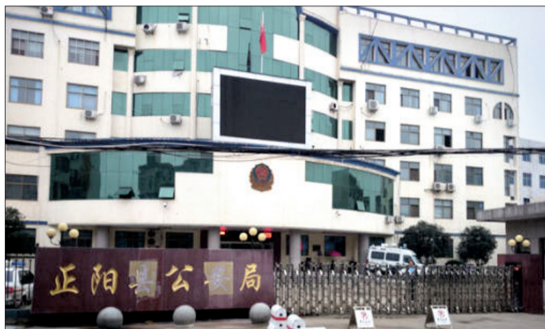
驻马店市正阳县公安局