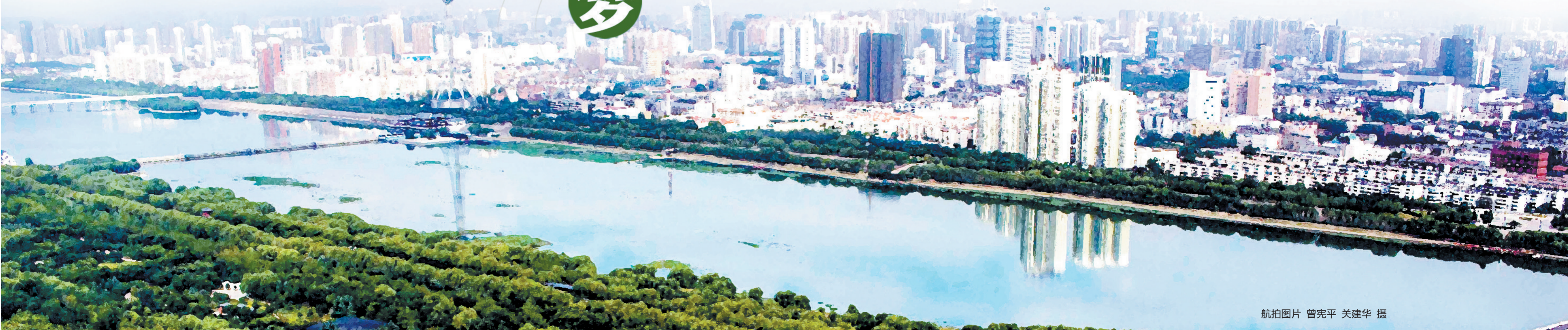
航拍图片

而且,难得的是,这里靠近市中心,离普通人的现实生活很近:购物中心、大型商超、豪华影院应有,还有多所知名学校、综合医院静候周边——站式生活,一站式享受,涧河可以为大多数洛阳人实现梦想中的水岸生活。