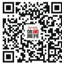
《洛阳晚报·休闲周刊》二维码