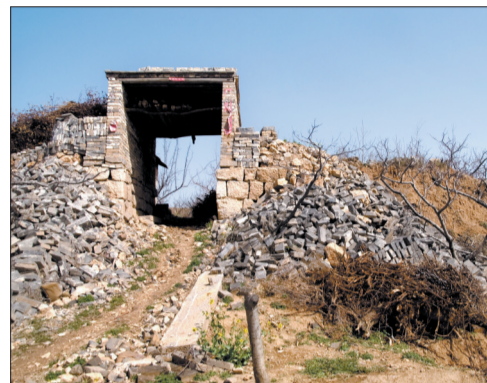
村民用老寨门残砖垒起的新“寨门”