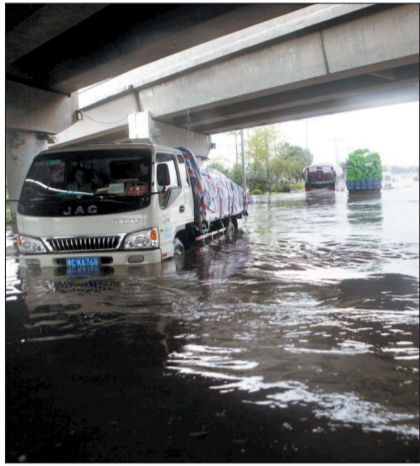
↑昨日下午,积水路段的积水更深了