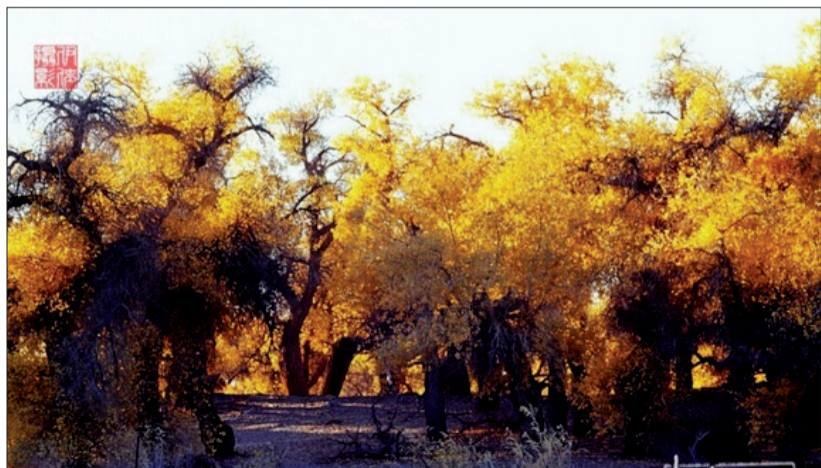
额济纳胡杨林 (资料图片)