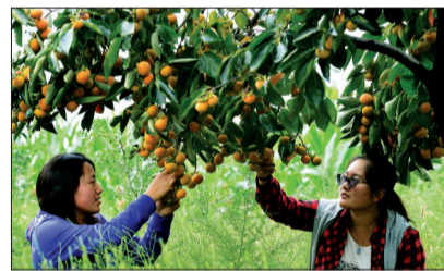
小浪底镇马屯村柿子园