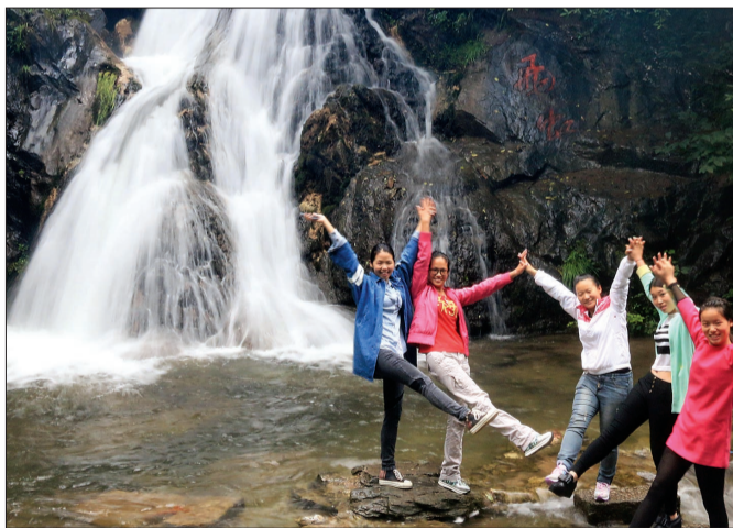
栾川重渡沟景区内的瀑布

●嵩县天池山景区：雨后的天池山五级飞瀑更如从天而降的玉带，飞奔而下，将天与地紧紧相连在一起；玉女溪碧水潺潺，石洁如洗；二郎沟深潭幽涧，瀑如玉龙。