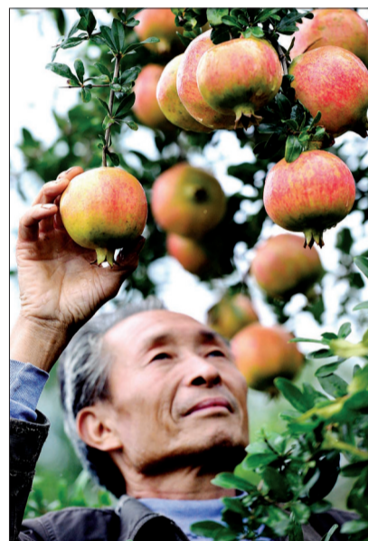
小浪底镇石门村石榴园