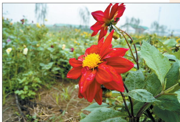
▲光瑞美好乡村迷你动物园